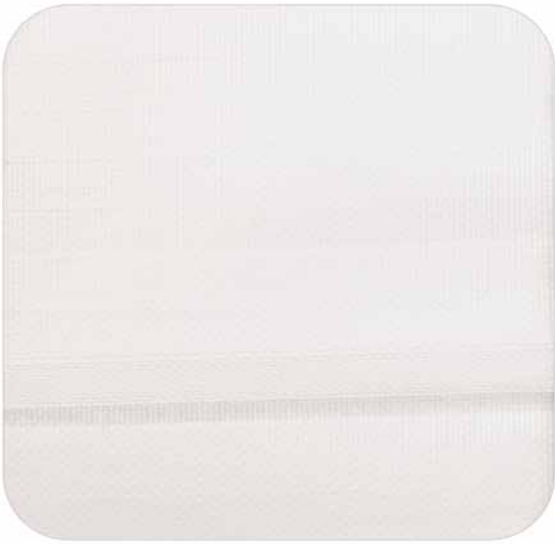
Blanco | White | 900