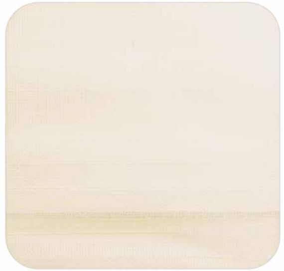
Crema | Cream | 115