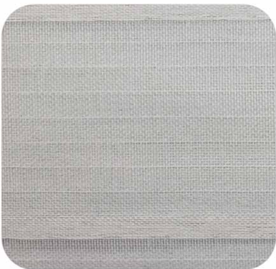
Gris | Grey | 867