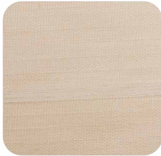
Beige | 938