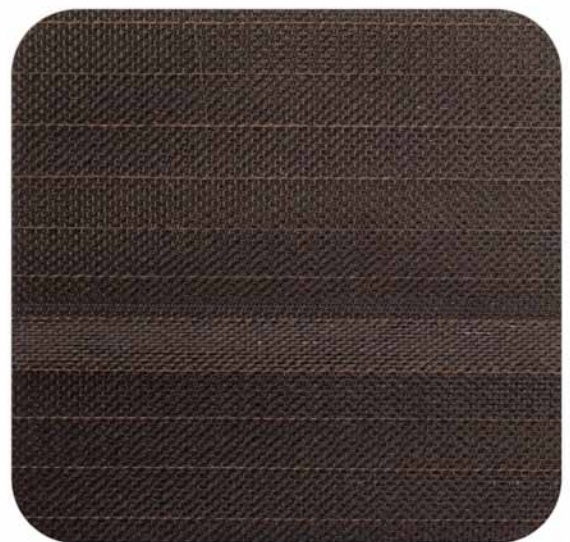
Chocolate | 814